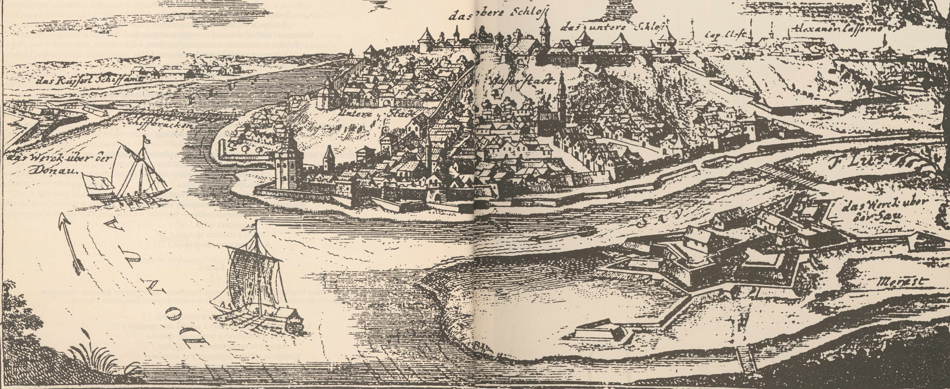
Изглед Београда на гравирани из прве половине XVIII века